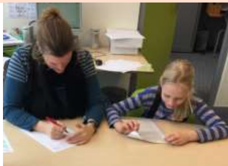
BIJNA ALLE KINDEREN ZIJN GOED VOORUIT GEGAAN MET LEZEN!