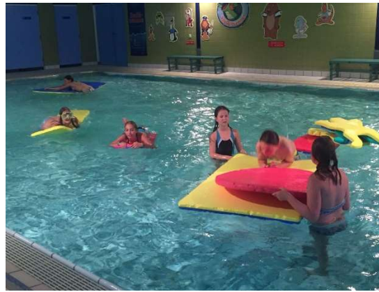
Lekker zwemmen in Malden.

Voor lange autoritten zijn bijvoorbeeld de vakantiedoeboeken van Rompom en Maan roos vis superleuk en leerzaam. Rijden maar!